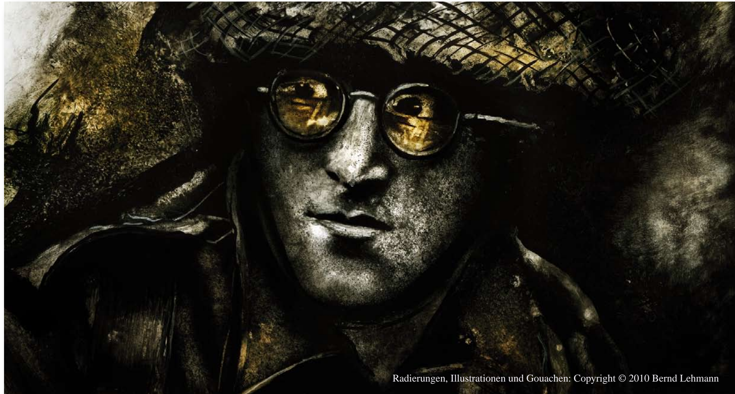
Radierungen, Illustrationen und Gouachen. Copyright © 2010 Bernd Lehmann